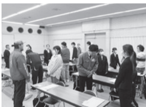
昨年度のセミナーの様子

問 東金商工会議所 TEL 0475(52)1101 【土日祝を除く 8:30～17:00】