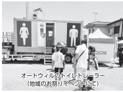
オートウィルのトイレトレーラー (地域のお祭りイベントにて)

に取り組んでおり、能登半島地震でのトイレトレーラーの派遣においても対応いたしました。このようにいつくるかわからない災害等に備えて対応できるように体制を整えてこれからの地域に貢献していきたいと思っています。また、今年の1月には4市町村目となる災害協定を東金市と締結しました。災害発生時に仮設トイレ付車両を避難所に配備する協定ですが、平時のイベント