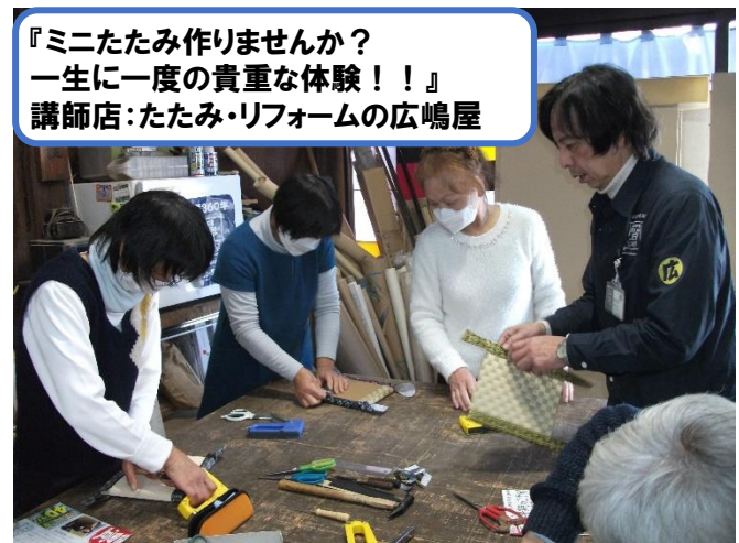
『ミニたたまみ作りませんか？ 一生に一度の貴重な体験!!』 講師店:たたみ・リフォームの広嶋屋