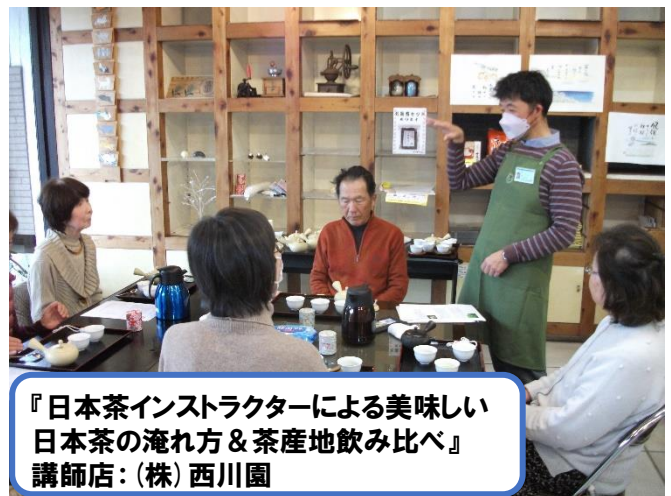
『日本茶インストラクターによる美味しい 日本茶の淹れ方＆茶産地飲み比べ』 講師店:(株)西川園