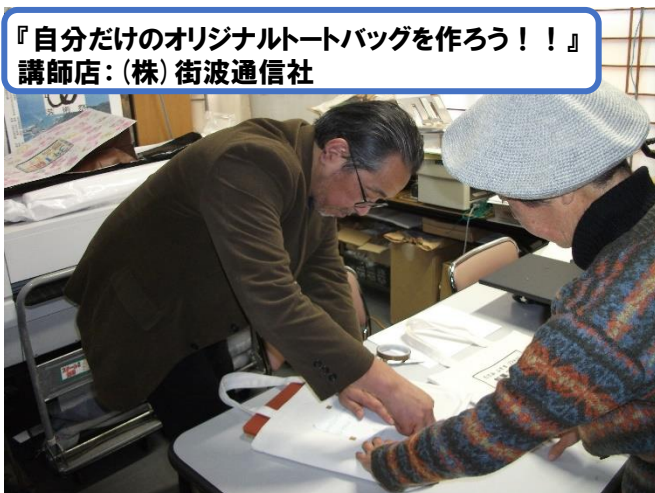
『自分だけのオリジナルトートバッグを作ろう!!』 講師店:(株)街波通信社