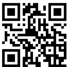
全国一斉まちゼミHPより