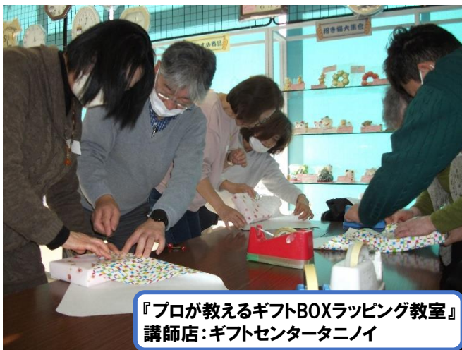
『プロが教えるギフトBOXラッピング教室』 講師店:ギフトセンタータニノイ