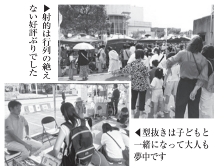
射的は行列の絶えない好評ぶりでした

8月10日(土)に東金市市制施行70周年記念のヤッサ東金祭が開催されました。当青年部では「ふるさとガーデン2024」を東金商工会館駐車場で大規模に開催いたしました。今回は、日本の古き良き縁日文化を再現し、射的や型抜きイベントブースを設置。13時からの開始でしたが、早くから多くの方々にお越しいただき、会場は熱気に包まれました。